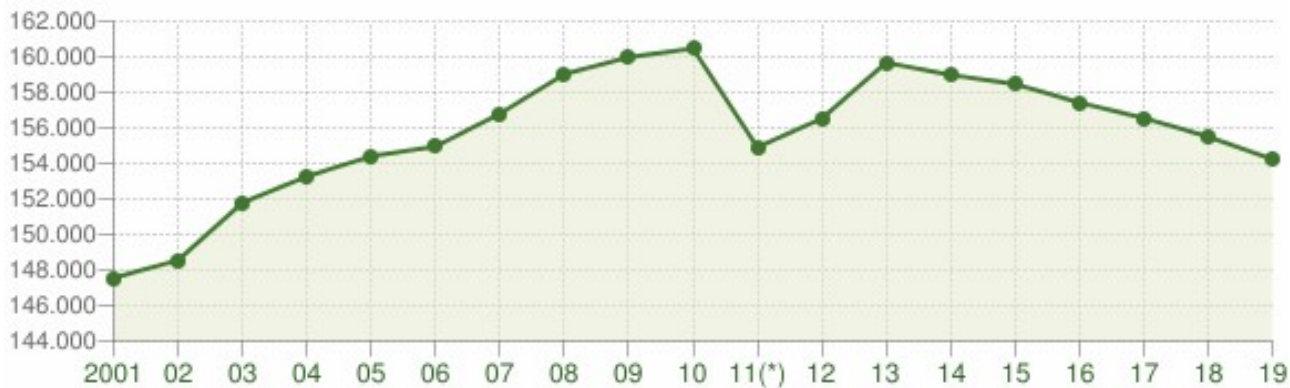
Andamento della popolazione residente

Andamento demografico della popolazione residente nel comune di Rieti dal 2001 al 2019. Grafici e statistiche su dati ISTAT al 31 dicembre di ogni anno.