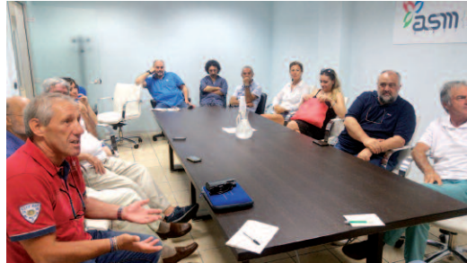
Un incontro in ASM tra azienda e associazioni.

All’incontro di presentazione del progetto tenutosi il 24 febbraio, sono seguiti incontri specifici sui temi Ambiente e Salute.